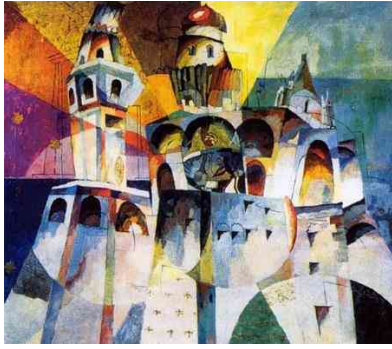
А. Лентулова. Звон (Колокольня Ивана Великого)

Представитель кубизма П. Пикассо стремился утвердить новые методы передачи пространства и формы, используя аналитический способ изображения предметов разложением их на простейшие геометрические объемы.