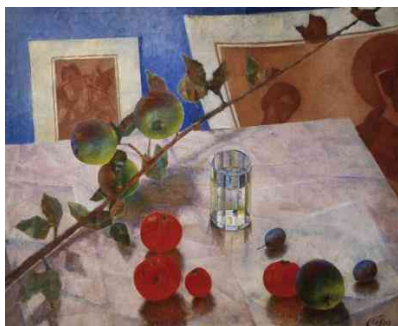
К. Петров-Водкин. Розовый натюрморт.

Натюрморт наиболее показателен и многообразен в плане изучения признаков декоративной стилизации. В нем работали многие большие мастера такие как К. Петров–Водкин, А. Матисс, шли по пути выявления декоративно – экспрессионистических возможностей цвета и фактуры.