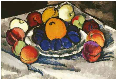
И. Машков. Натюрморт. Фрукты на блюде.

Фовисты создавали колористические контрасты интенсивных пятен и острые композиционные ритмы, часто обращаясь к примитивному, а также средневековому и восточному искусству. Декоративные натюрморты И. Машкова были созданы под влиянием кубистов и фовистов. Машкова называют «королем натюрмортов», и это звание вполне заслужено. «Фрукты на блюде» написаны в период освоения художником плоскостной живописи, жанра вывески.