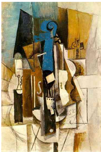
П. Пикассо. Скрипка в кафе.

Представитель кубизма П. Пикассо стремился утвердить новые методы передачи пространства и формы, используя аналитический способ изображения предметов разложением их на простейшие геометрические объемы.